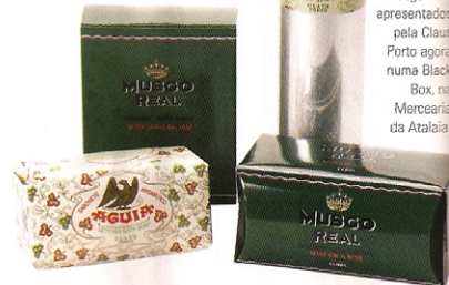
Produtos da emblemática Musgo Real apresentados pela Claus Porto agora numa Black Box, na Merceria da Atalaia.