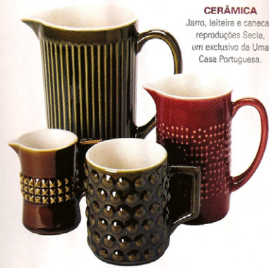
CERÂMICA Jarro, leiteira e canecas, reproduções Secla, um exclusivo da Uma Casa Portuguesa.