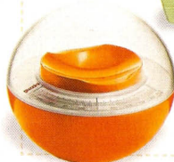
Balança Sfera, da Guzzini, €41,50, na Sparkle