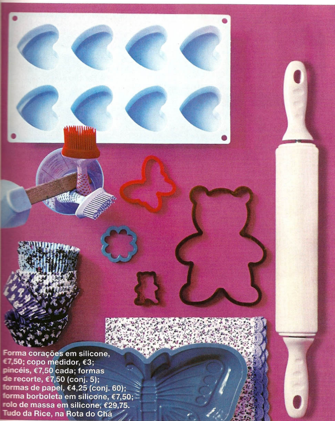
Forma corações em silicone, €7,50; copo medidor, €3; pincéis, €7,50 cada; formas de recorte, €7,50 (conj. 5); formas de papel, €4,25 (conj. 60); forma borboleta em silicone, €7,50; rolo de massa em silicone, €29,75. Tudo da Rice, na Rota do Chá

Das formas às batedeiras, acessórios úteis que o tornarão num mestre pasteleiro. Veja a montra.