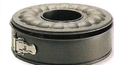
Forma desmoldável Prompt, €6,93, na Ikea