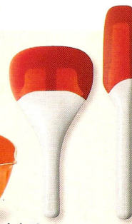
Espátula de borracha, 2 unidades, €4,99, na Ikea