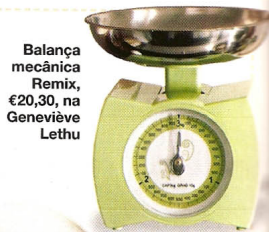
Balança mecânica Remix, €20,30, na Geneviève Lethu