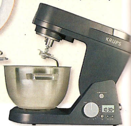
Máquina de cozinha: balança, taça em inox, copo liquidificador, livro receitas, €500, da Krups