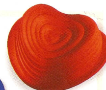
Forma em silicone da Guzzini, €20 na Sparkle