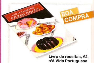
Livro de receitas, €2, n'A Vida Portuguesa

Das formas às batedeiras, acessórios úteis que o tornarão num mestre pasteleiro. Veja a montra.