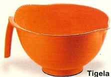
Tigela Latina, da Guzzini, €16,50 na Sparkle