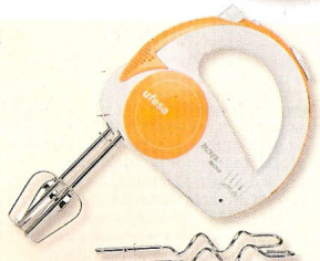
Da Ufesa, €24,99