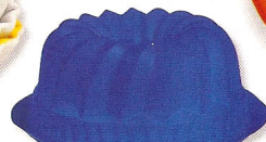
Forma Classic em silicone, da Lékue, €15,50, no El Corte Inglés