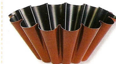
Forma em metal Granforno, da Domo para Brioche, €10,50, no El Corte Inglés