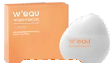
Woman's Secret. Perfume. 15,95 €