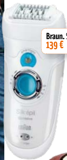
Braun. Silk épil. 139 €