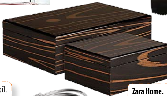
Zara Home. Caixas. 49,90€