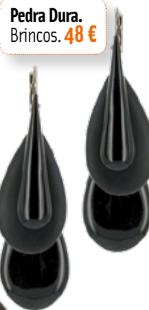
Pedra Dura. Brincos. 48 €