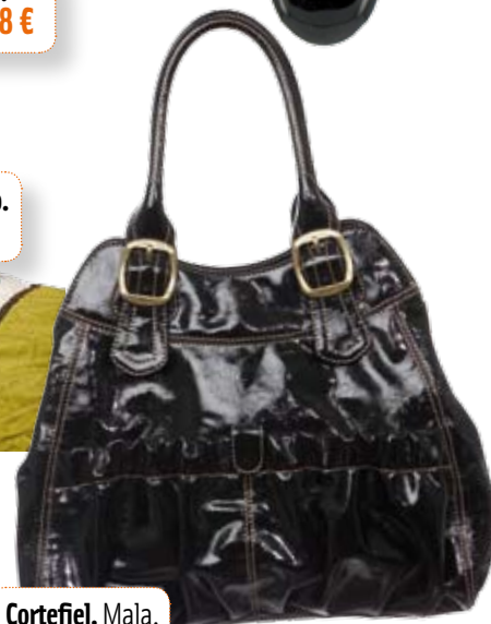
Cortefiel. Mala. 49,90 €

Benetton , tel.: 22 207 34 60; Yves Rocher , www.yves-rocher.es ; A Vida Portuguesa , tel.: 213 465 073; Pedra Dura , tel.: 21 440 68 69; A Loja do Gato Preto , www.alojadogatopreto.com ; Cortefiel , tel.: 21 716 39 79; Just Cavalli , 21 360 07 20; Ikea , www.ikea.com/pt ; Zara Home , www.zarahome.com ; Woman's Secret , tel.: 21 716 39 79; Naf Naf , tel.: 21 394 13 26; Blanco , tel.: 21 478 55 86; Parfois , tel.: 220 900 800; Oysho , tel.: 28 956 18 98; L'Occitane , tel.: 213 476 204; Salvador Bachiler , tel.: 96 875 56 75; Olay , tel.: em supermercados; FunBasics , tel.: 21 386 82 03; Springfield , tel.: 21 716 39 79; Accessorize , tel.: 21 386 83 60; AKI , tel.: www.aki.pt ; Braun , tel.: 214 409 000.