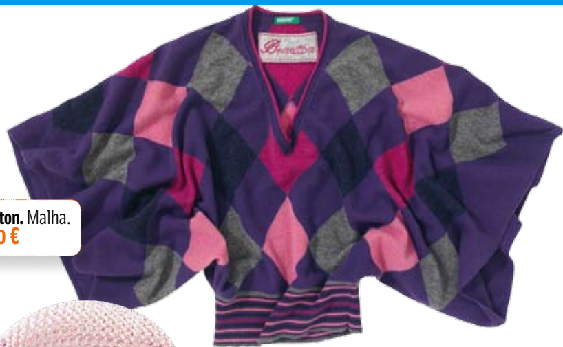
Benetton. Malha. 49,90 €