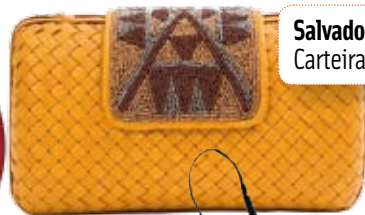
Salvador Bachiller. Carteira. 40 €