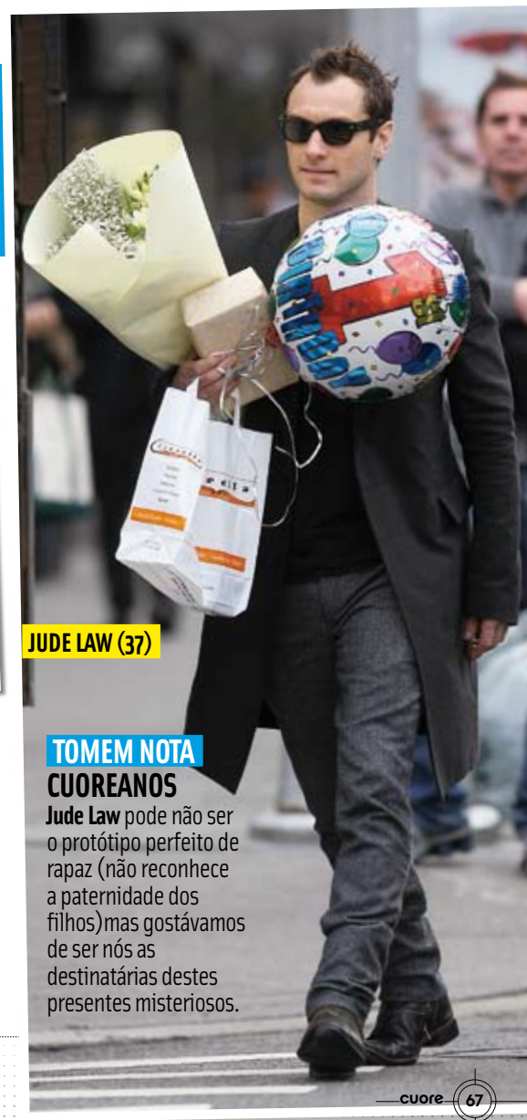
JUDE LAW (37)