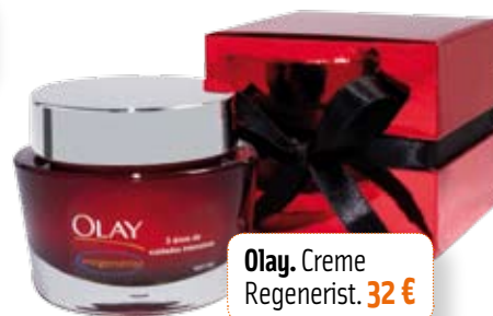
Olay. Creme Regenerist. 32 €