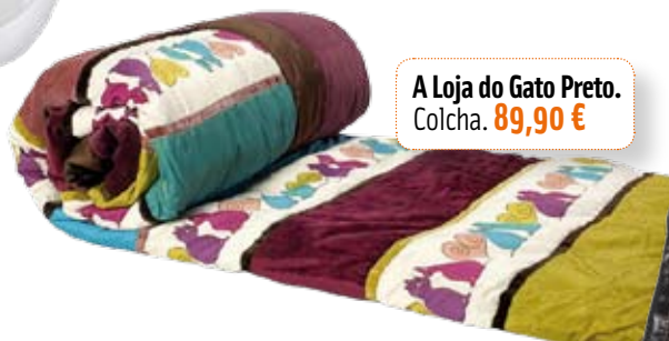
A Loja do Gato Preto. Colcha. 89,90 €