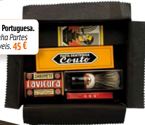
A Vida Portuguesa. Caixinha Partes Sensíveis. 45 €