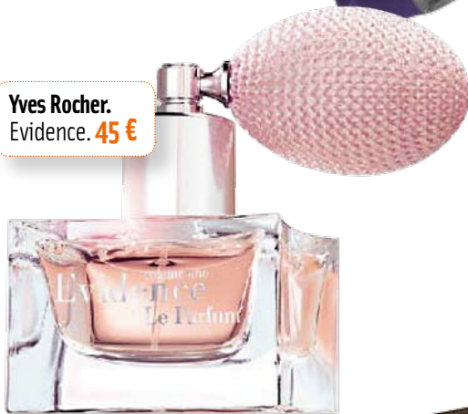
Yves Rocher. Evidence. 45 €