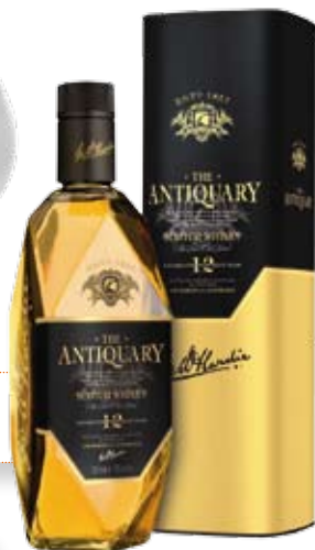
Antiquary. Whisky 15 €