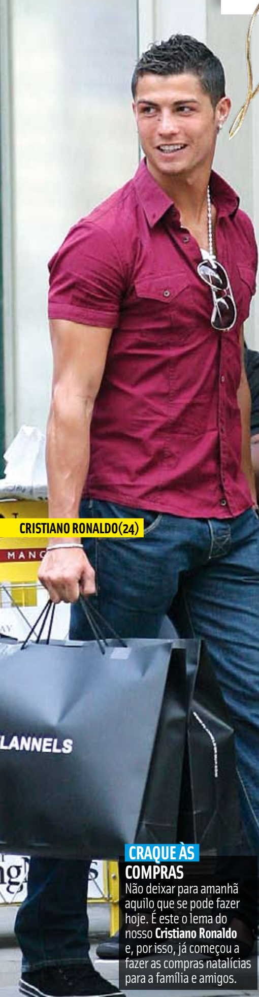
CRISTIANO RONALDO (24)