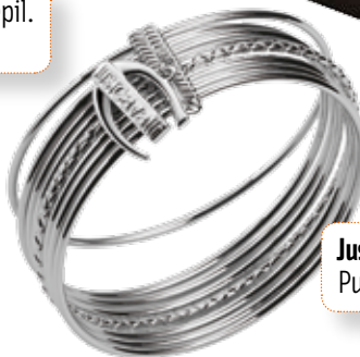
Just Cavalli. Pulseira. 78 €