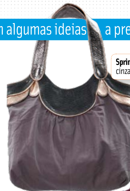
Springfield. Mala cinza. 25,95 €