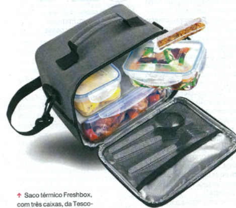
↑ Saco térmico Freshbox, com três caixas, da Tesco-Portugal (35,90 euros)

Coloridas ou monocromáticas, com linhas modernas ou mais vintage, levar a comida para o trabalho voltou a ser um hábito português, sem estigma e com muito estilo.